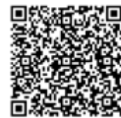
Edikasyon espesyal nan Vil Nouyòk