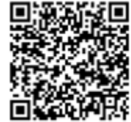
Gid fanmi ki gen timoun ki gen laj pou ale lekòl