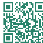
Видео о поступлении в средние школы

СОВЕТ. Посмотрите серию видео о приемном процессе в среднюю школу на сайте schools.nyc.gov/HS , в специализированную среднюю школу — schools.nyc.gov/SHS . Вы узнаете, как искать программы, создать аккаунт MySchools и подать заявление